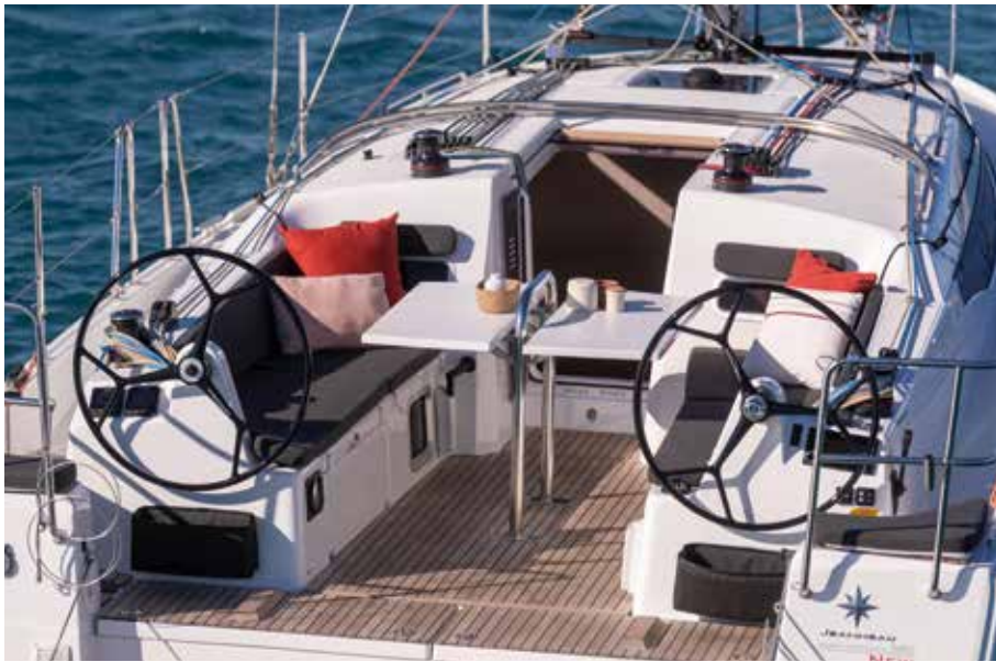
◀ A fully equipped cockpit Un cockpit très bien équipé Ein voll ausgestattetes Cockpit Una carlinga muy bien equipada Un pozzetto completamente attrezzato