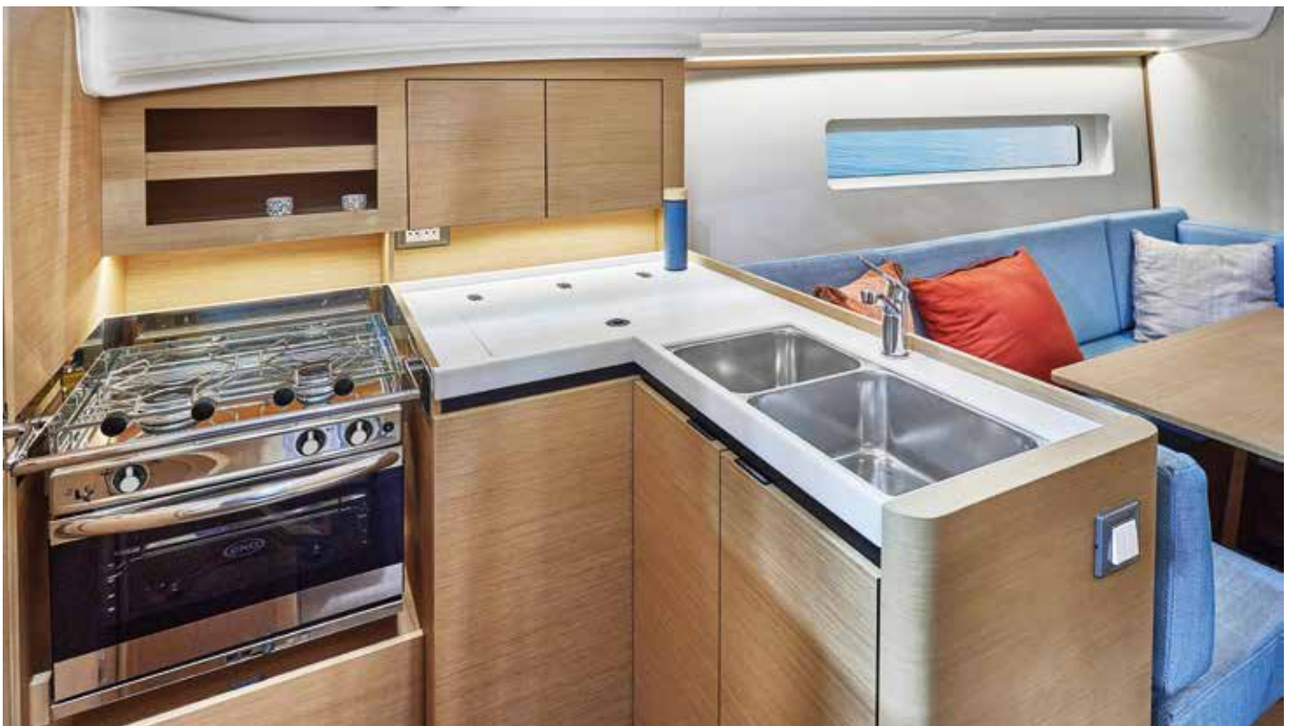
▼ A sofa on the starboard side that invites you to relax Un sofa sur tribord qui invite à la détente Ein Sofa auf der Steuerbordseite, das zum Entspannen einlädt Un sofá a estribor que invita a relajarse Un divano a dritta che vi invita a rilassarvi