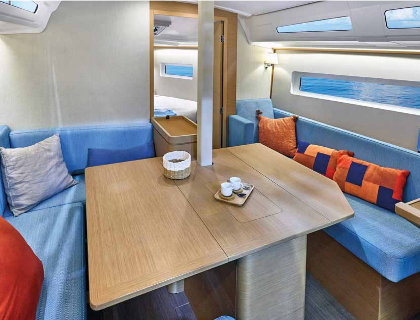
▲ A warm and bright saloon. Un carré lumineux et chaleureux Ein warmer und heller Salon Una zona de estar cálida y luminosa Un salotto caldo e luminoso