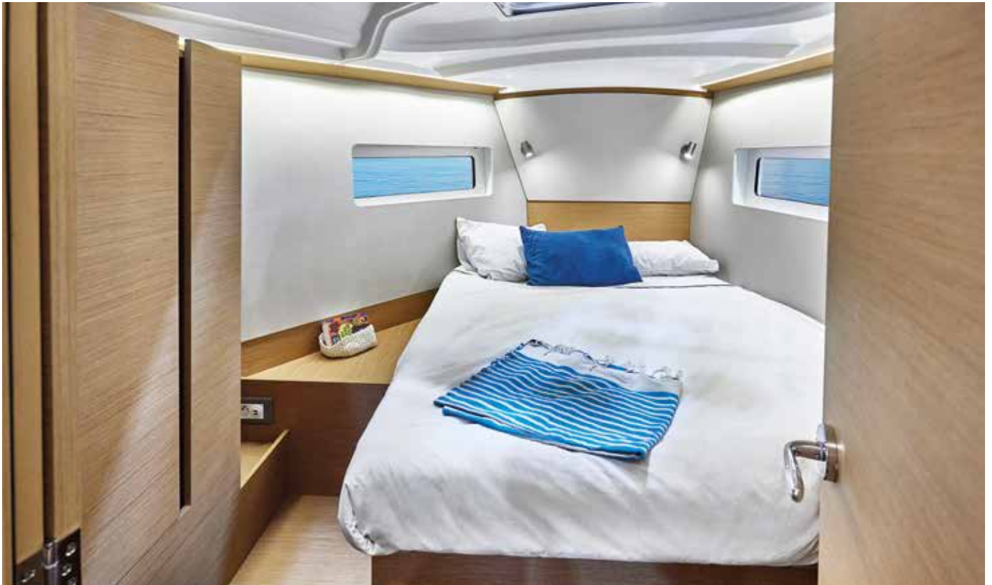
▲ Large and comfortable front owner's cabin with rectangular berth Grande et confortable cabine propriétaire avant, avec lit rectangulaire Große und komfortable vordere Eignerkabine mit rechteckigem Bett Amplio y confortable camarote de armador en proa con cama rectangular Cabina armatoriale di prua ampia e confortevole con letto rettangolare