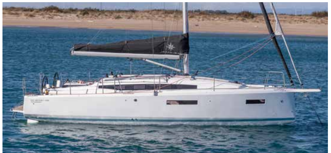
► Racy and modern lines Des lignes racées et modernes Racy und moderne Linien Líneas modernas Linee moderne